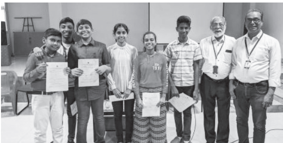
STARTT LOGICAL REASONING WINNERS