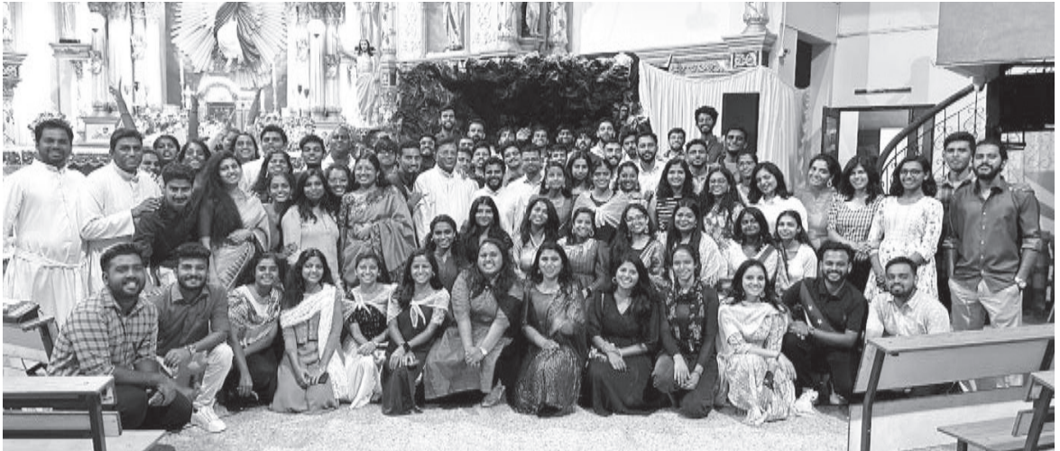
BBQ night took place on Easter Eve with some fun and good food to celebrate the message of hope and life of Jesus.