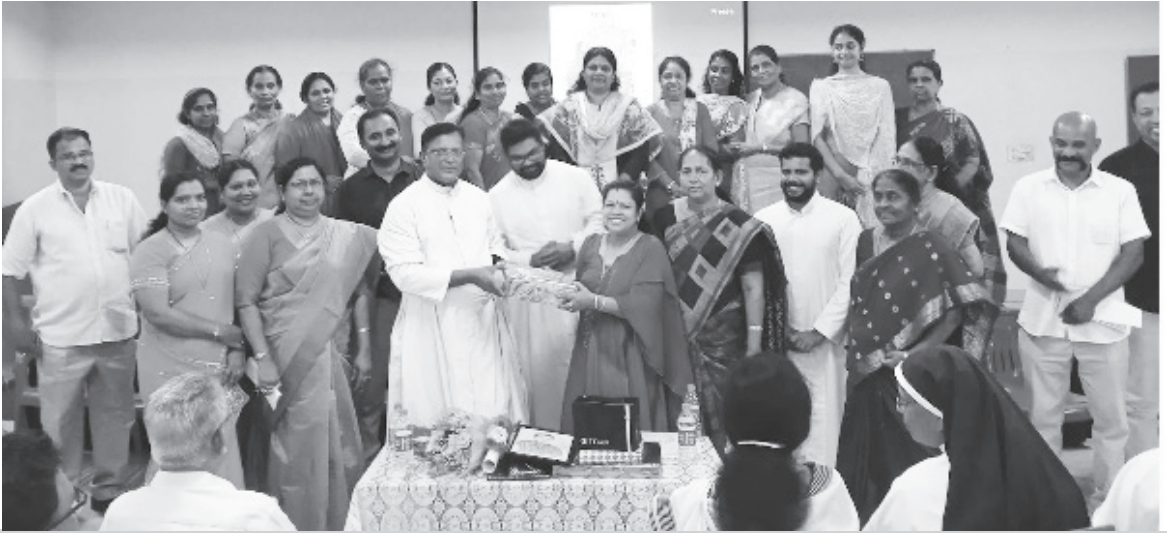
മാത്യുവേദി അംഗങ്ങൾ സിറിയക് മാന്തിൽ അച്ചന്റെ യാത്രയയപ്പു ചടങ്ങിൽ.