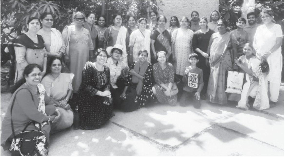
മാത്യുവേദി അംഗങ്ങളുടെ വൺഡേ ട്രിപ്പ്