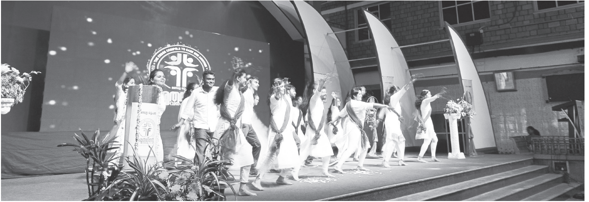
St. Thomas Youth was the backbone on all the days in the Holy Week and enacted a tableau on Good Friday. The Easter eggs decorated with social messages were appreciated by everyone.