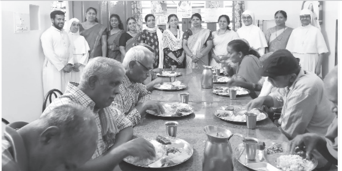
മാത്യുവേദി അംഗങ്ങൾ കൃപാലയ അന്തോവാസികളോടൊപ്പം മാത്യുദിനം ആഘോഷിക്കുന്നു.