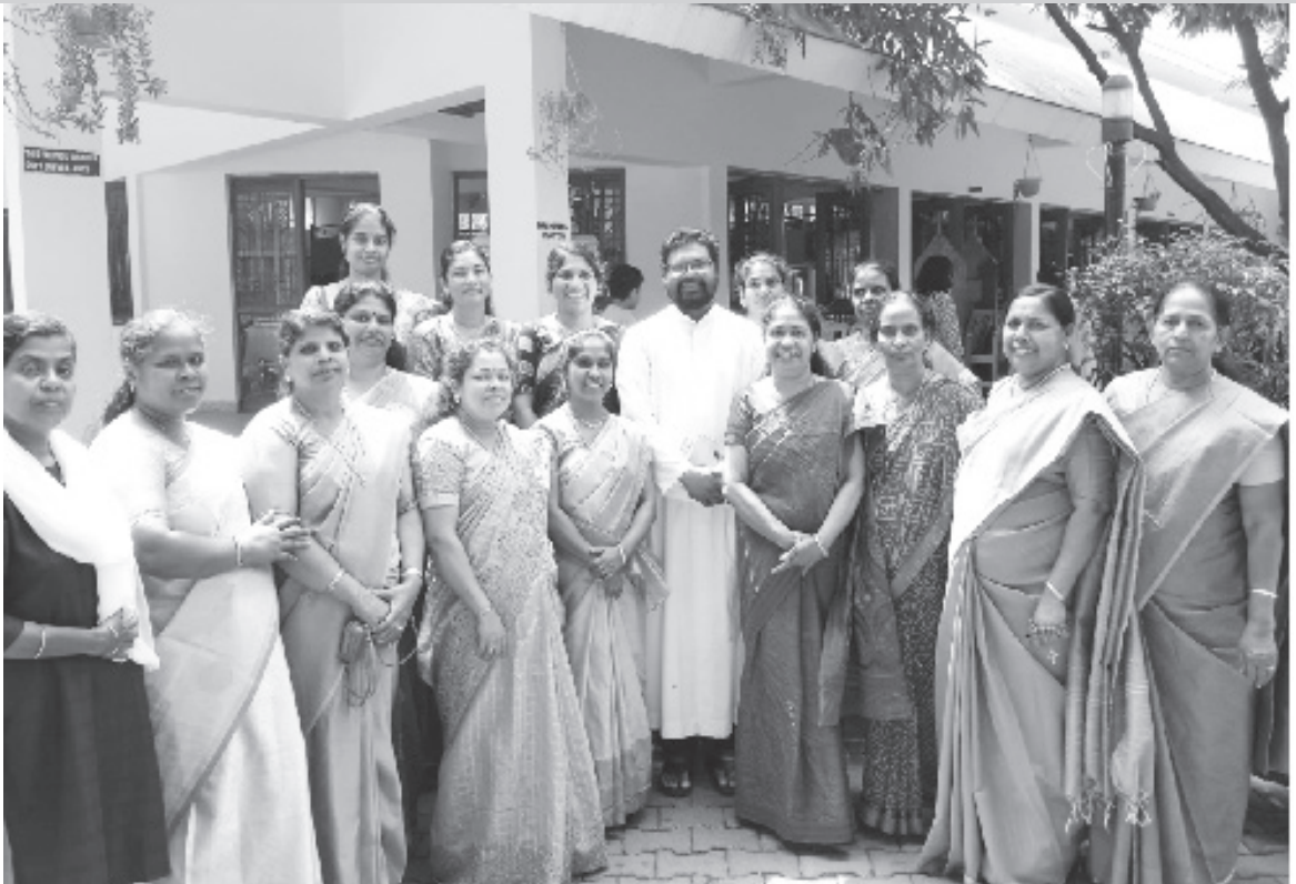
മാത്യുവേദി അംഗങ്ങൾ പരിസ്തമിദിനത്തിൽ പരിസ്തമിയെപ്പറ്റി ബോധവൽക്കരണം നടത്താൻ ലഘുനാടകം സംഘടിപ്പിച്ചു.