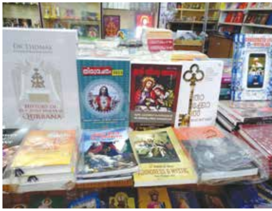
Santhome Book Stall New Arrivals