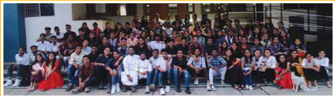
Carlo Eucharistic Community Hillside Nursing College, Kanakpura