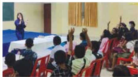
STARTT Creative Writing Session