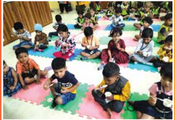
Santhome Kinder Fruit Salad Day