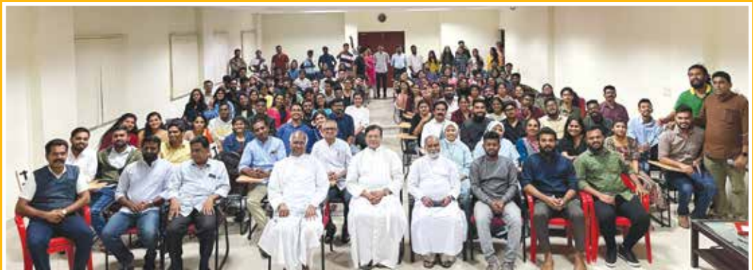
Thanks Volunteers Yuvachanotsava