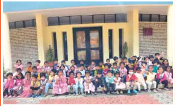
Santhome Kinder Field Trip to DVK