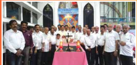
Opees & Prayer for Departed Souls by Pithruvedi