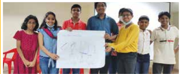
STARTT Mad Ads Competition- 1st prize winners