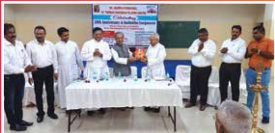
20 th Anniversary & Kudumbasangamam Pithruvedi