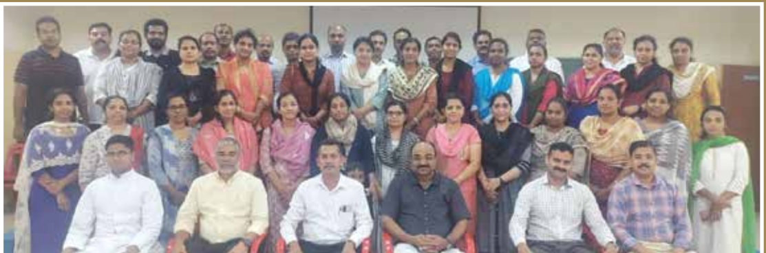
9th Std PTA meeting. Last PTA meeting for the year