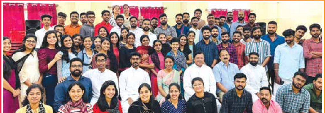
Santhome Professional Forum