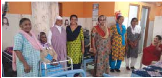
Monthly krupalaya visit by mathruvedhi